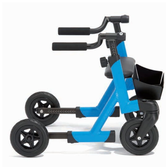
本体：ホイールベース調整式