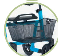
バスケット (上：サイズ0.1 下：サイズ2.3)