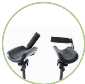
アームホルダー (ホイールベース調整式本体にしか使えません)